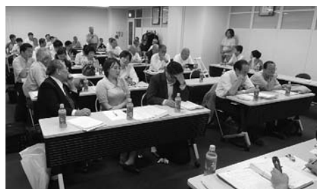
1日目會員大會討議の様子

去る5月28日(月)より、北京にて第9届世界華裔傑出青年華夏行が開催され、74の国・地域より5000余名が集まった。日本からは京都華僑總會事務局長蔡明芳、神戸華僑總會石鋒、神戸東町法律事務所表志明を含む16名が参加した。 28日午前、人民大会堂にて國務院國務委員楊潔篪、全國政協副主席李海峰、國務院僑務辦公室主任裘援平ら計14名が出席し、開幕式が行われた。 楊潔篪氏は挨拶の中で華裔は中國の誇りであり、民族復興、「中國夢」の実現には必要不可欠であると述べると共に、3つの希望を出した。1、中國を理解し、橋渡しを行う。2、チャンスを共有、協力を強化し、事業発展に努める。3、華僑社會に關心を持ち、未來を率いる。 また、表援平副主任は「民族の根」、「文化の魂」、「復興の夢」が我々を強く結びつけ、世界の各所で多く人材が輩出され、多くの華裔青年が活躍し、世界各國との友好、交流の架け橋となっている」と述べた。 28日午後及び29日午前には、専門家を招き、文化、外交、經濟等のテーマで特別講演が行われた。 28日午後は「震撼する中國—文明國家の勃興」、中國文化—伝統の精髓と現代価値、29日午前は「中國外交—政策と実践」、「中國經濟—形勢と予測」の講演が行われ、また、講演では質疑応答の時間も設けられ、多くの青年が質問する姿が見られた。 29日午後からは鳳凰衛視の協賛で「華裔傑出青年フォーラム」が行われ、五大州より選ばれた華裔青年達が「華裔青年の未來と中國」、「華裔青年の責任と世界」の2つのテーマに沿って意見を述べ、各青年が自國における周囲の環境、役割を話し、司會者や客席の青年の質問に答えた。 また、このフォーラムは2回にわたり鳳凰衛視にて放映された。 30日からは北京、浙江、山東、河南、陝西の5つのルートに分かれ、4日間にわたり、各地の視察や要人と接見、交流を行った。