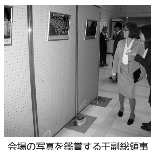
会場の写真を鑑賞する于副総領事

開催期間中、多くの方が写真展に訪れ、24日午後3時に無事に閉幕した。今後、大阪市中央区役所