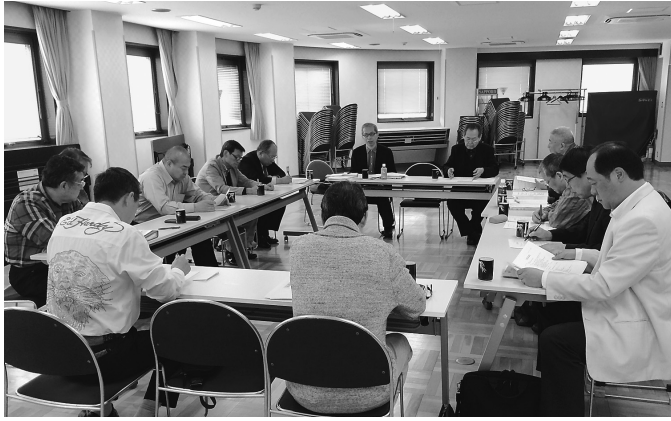
会議中の様子(各地より代表が集まり議論が行われた)